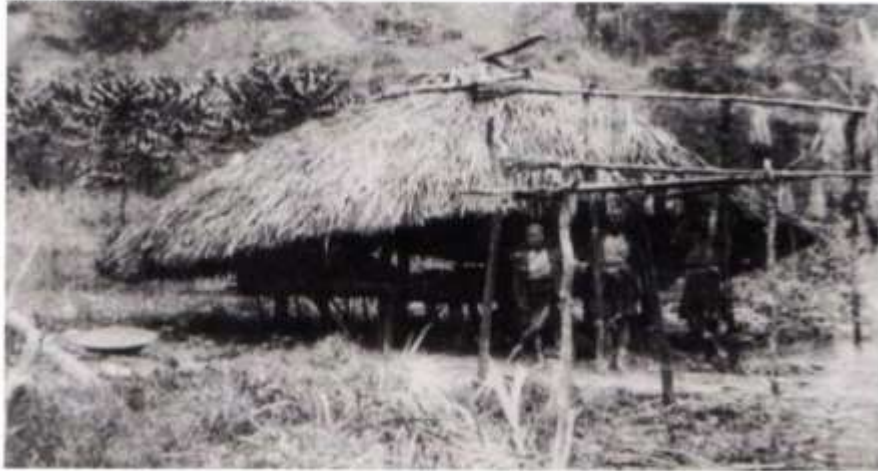
ガニ社では、男性だけが集落集会場に集まる。写真はそのタブライシィーア (集落集会場) と思われる。