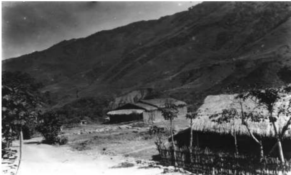
日據時期拉阿魯哇族家屋

傳統家屋形體多為長方形，單室不隔間，屋頂前後(棟的方向)兩端屋頂低，約二、三尺高，以茅草覆頂，其稜角頓而帶圓，立面看時，恰呈橢圓錐體狀。梁柱以黃櫨、檫樹、樟樹、茄苳、楠木、烏心樟等堅硬木材構成。牆壁則以茅草的莖直立排列，再以細藤編制為兩層。入口部分，左為男性入口、右為女性入口，另設有通往穀倉之門。屋內設有爐火、床臺、墓穴等。